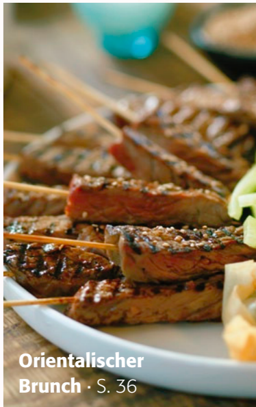
Orientalischer Brunch · S. 36