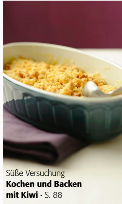
Süße Versuchung Kochen und Backen mit Kiwi · S. 88