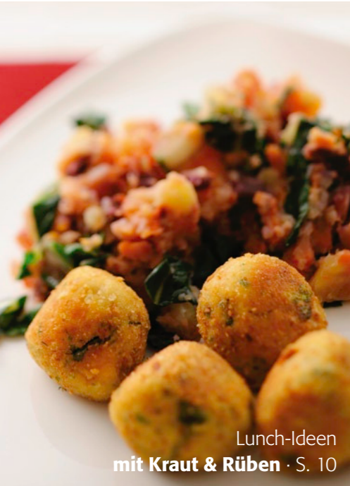
Lunch-Ideen mit Kraut & Rüben · S. 10