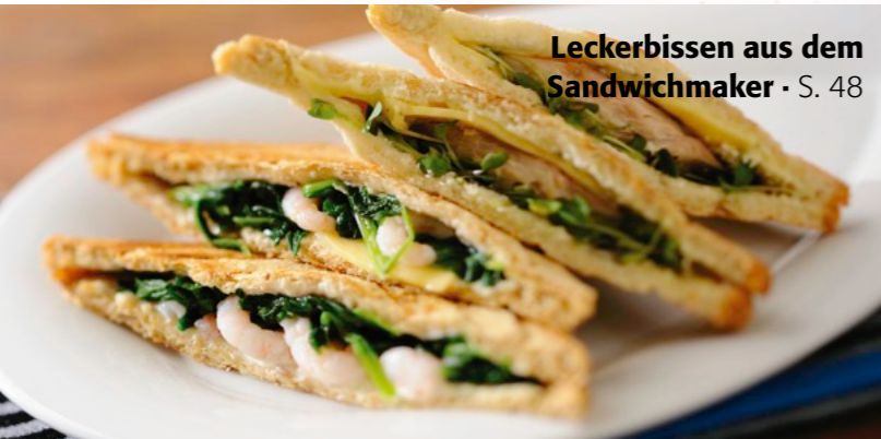
Leckerbissen aus dem Sandwichmaker · S. 48