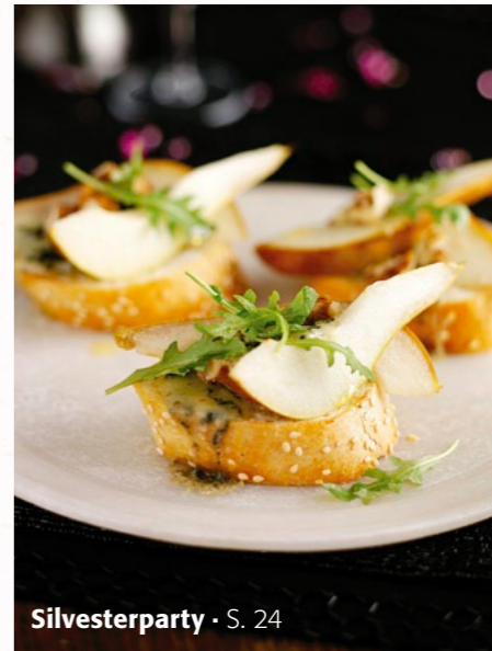
Silvesterparty · S. 24