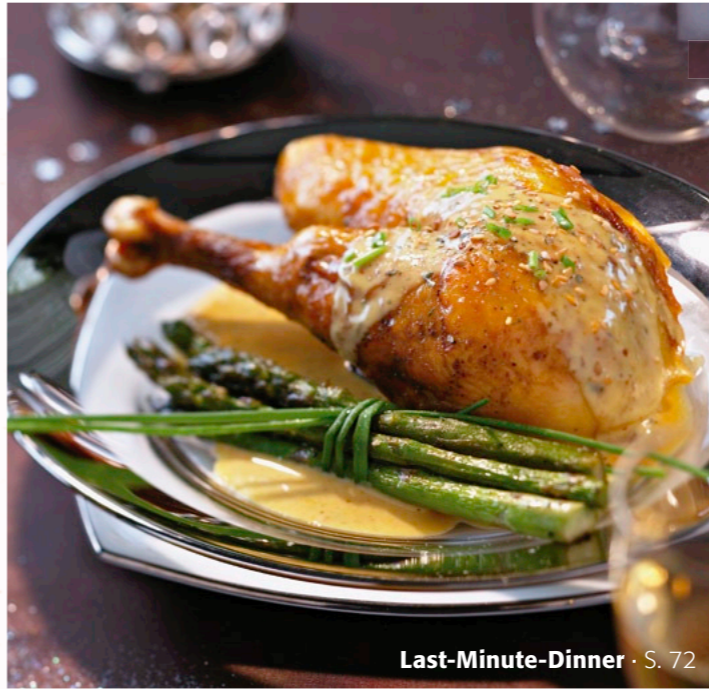
Last-Minute-Dinner · S. 72